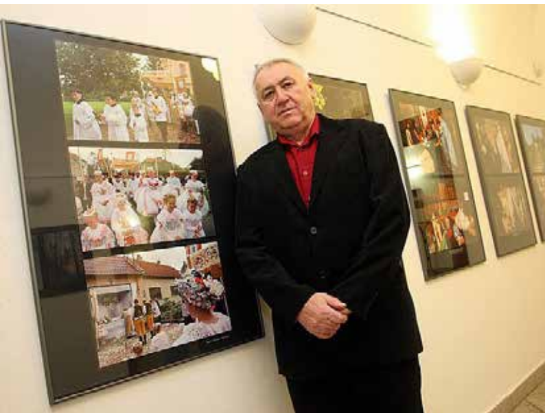
Výstavy ve spolupráci s muzeem a reprízy výstavy JAK chtěl změnit svět